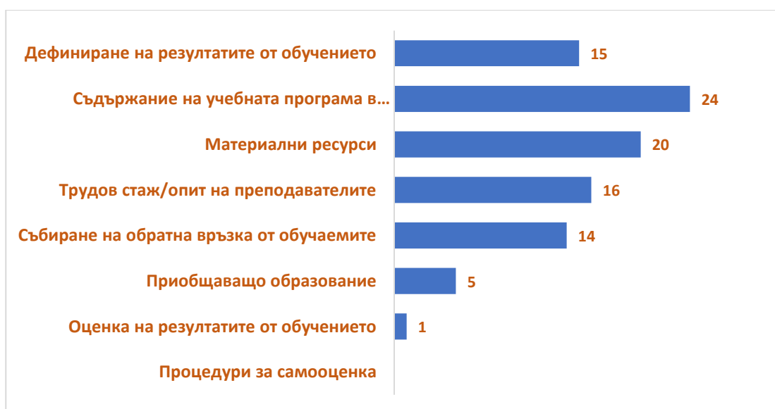
Фиг.3. Разпределение на отговорите на въпрос №3