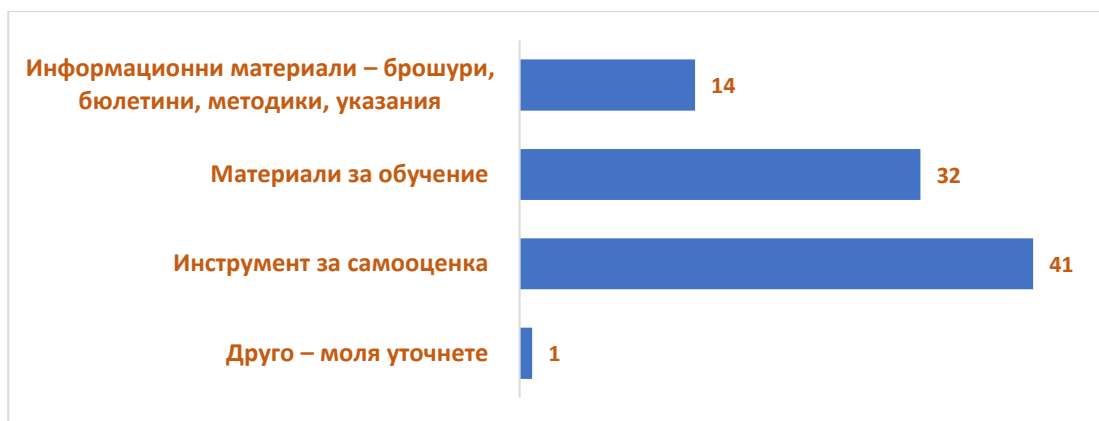
Фиг.4. Разпределение на отговорите на въпрос №4