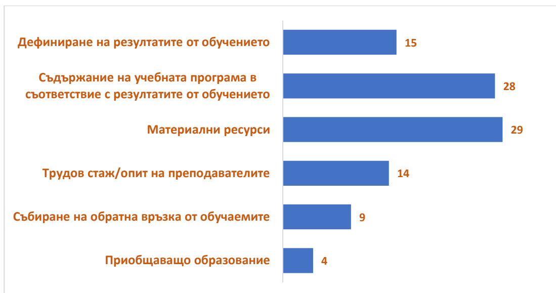
Фиг.2. Разпределение на отговорите на въпрос №2